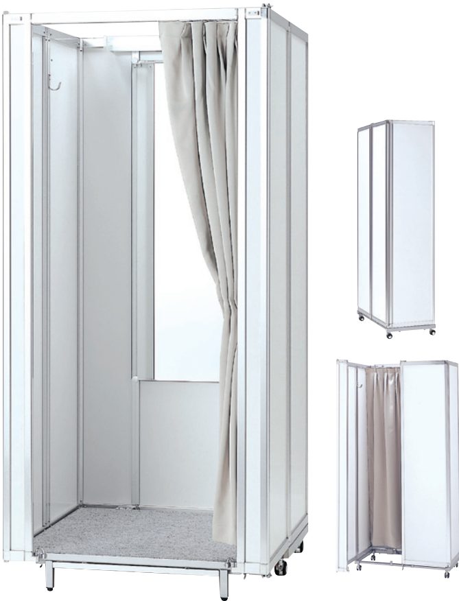
軽量ハードタイプ [SFR-01]